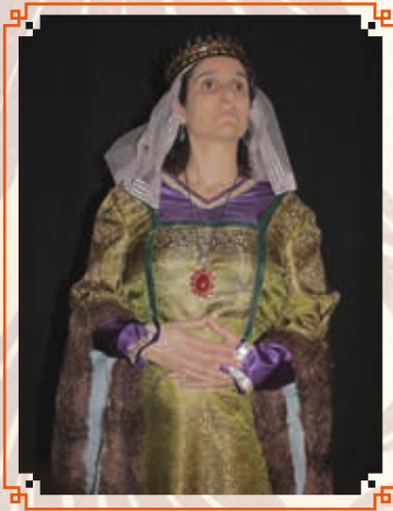
REINA ELIONOR DE SÍCILIA