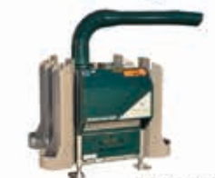
FrostGuard Protección máxima 1 hectárea