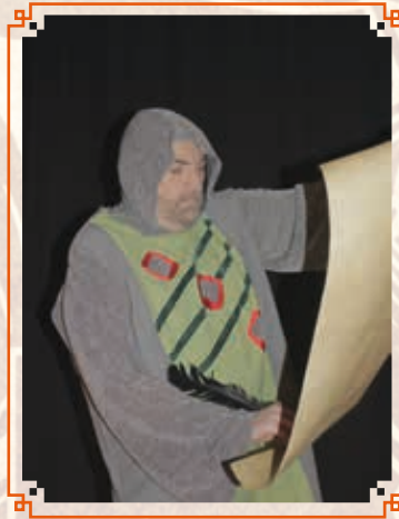
SÍNDIC DE SABADELL