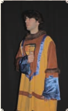
VESCOMTE DE CASTELLBO