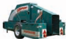
Frostbuster Protección máxima 8 hectáreas