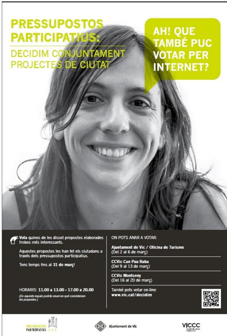
Cartell de la campanya de votacions