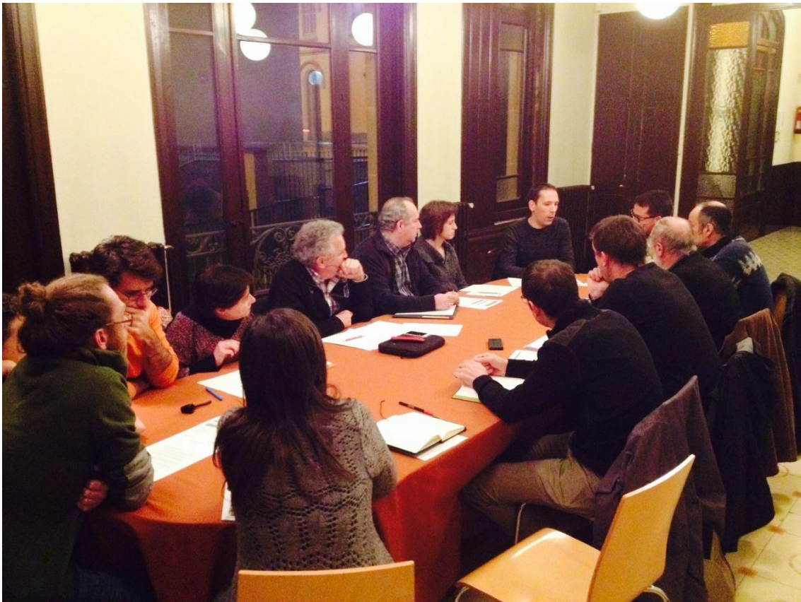
Delegats de les Taules i del Consell de Ciutat discutint si les 17 propostes han de passar a votació

Al llarg del mes de desembre les 17 propostes han passat a una Comissió de Valoració Tècnica, en la que els tècnics municipals han analitzat la viabilitat tècnica i econòmica de les propostes. Aquesta Comissió ha celebrat tres reunions – dues per a les propostes de caràcter més social i una per les urbanístiques - i han resolt que 16 de les 17 propostes són viables i que caldria introduir una modificació a la restant.