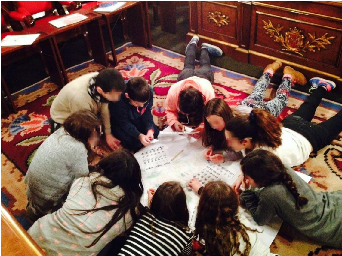
Els consellers fan un taller de mapeig col·lectiu per detectar les necessitats de la ciutat.

Atès que es tracta d'un projecte que es durà a terme des d'ara fins a finals de curs i que es treballarà conjuntament amb les aules, al llarg del mes de gener de 2015 s'han dut a terme sessions informatives a totes les escoles de primària de la ciutat per tal d'explicar a la resta d'infants de sisè què són els pressupostos participatius i com s'organitzarà el procés de construcció de propostes i de votació de les mateixes. Des de la Unitat de Participació també està previst organitzar sessions de treball a les aules amb vistes a donar-los suport al llarg del procés i en especial en la fase d'elaboració de les propostes.