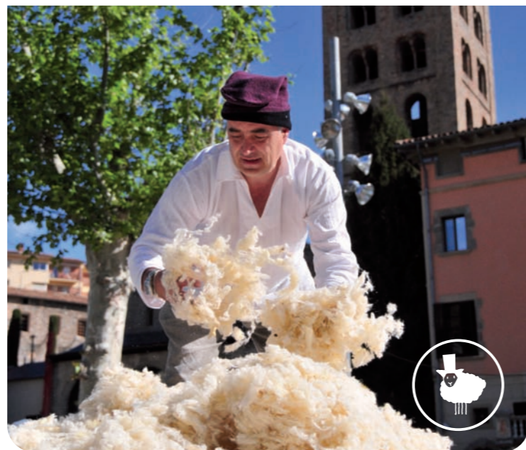
Imag. MANDEU S. - Ripoll