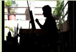
Carinyoteràpia Ignasi Costa Catalunya, 2013

Pantalla Oberta 16 de gener Un món feliç 13 de febrer Cineclub Xic 23 de febrer