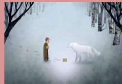
El secret del llibre de Kells ( The Secret of Kells ) Tomm Moore, Nora Twomey França-Bèlgica-Irlanda, 2009