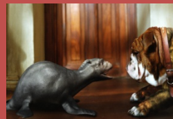
El meu monstre i jo Jay Russell Estats Units-Regne Unit-Austràlia, 2007