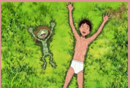
Un estiu amb en Coo Kappa no ku to natsu yasumi Keiichi Hara Japó, 2007

Cineclub Xic 26 de gener Cineclub Xic 9 de febrer Cineclub Xic 23 de febrer