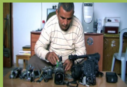
5 càmaras rotas 5 Broken Cameras Emad Burnat i Guy Davidi Palestina, 2011

Cineclub Xic 26 de gener Cineclub Xic 9 de febrer Cineclub Xic 23 de febrer